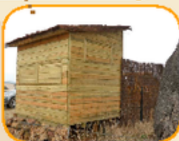
OBSERVATORIO "La Laguna"

Situado próximo a la localidad de La Granjuela (Córdoba) próximo al itinerario ornitológico "La Piruetanosa" y cerca de la antigua laguna de Peñalazorra, una zona encharcable en los meses lluviosos, y uno de los tradicionales dormitorios de grullas de la comarca.