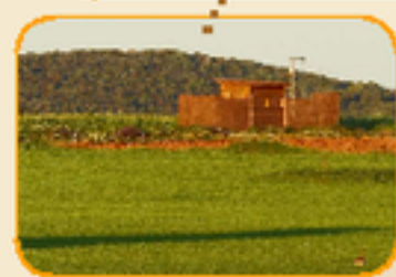
OBSERVATORIO "Los llanos del valle"

Situado próximo a la localidad de Los Blázquez (Córdoba) en el paraje conocido como "Los llanos del valle" y próximo al itinerario ornitológico "Tierras de avutardas", en una zona de lek de avutardas y zona de apareamientos de sisones.