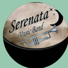
23:30 h. Orquesta Serenata