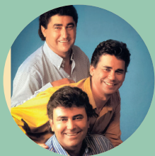
22:00 h. Los Requeibros