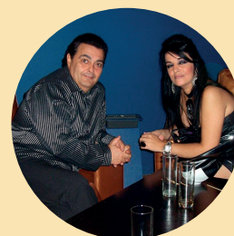
16:30 h. Dúo Los Cenacheros