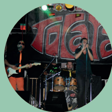
19:00 h. Grupo Musical Tocata Versiones