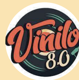
19:00 h. Grupo Musical Vinilo 8.0